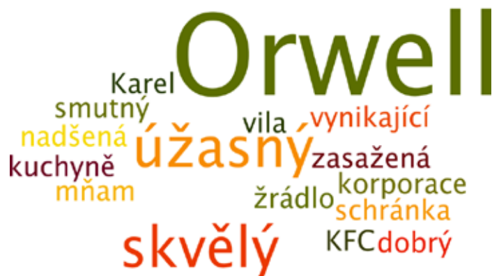
Slovomrak (čti wordcloud) je vizualizací reakcí diváků ihned po představení. Čím větším písmem je výraz uveden, tím vícekrát jej diváci v souvislosti s představením pronesli.